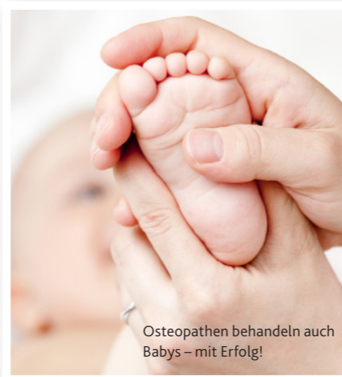
Osteopathen behandeln auch Babys – mit Erfolg!

Anwendungsgebiete: Die Lymphdrainage wird meistens ergänzend zu Krankengymnastik und Kompressionstherapie durchgeführt und kann dann helfen, wenn sich Lymphflüssigkeit im Gewebe staut und dadurch zum Beispiel ein Bein oder Arm anschwillt. Zu so einem Stau kann es beispielsweise durch eine Operation kommen, wenn ein Schnitt die Lymphbahnen durchtrennt hat“, so der Experte. So sei etwa ein Lymphödem am Arm eine häufige Folge von Brustkrebs-Operationen. Aber auch Sportverletzungen, Venenschwäche oder eine genetische Veranlagung können zu einem Stau der Lymphflüssigkeit führen. ■